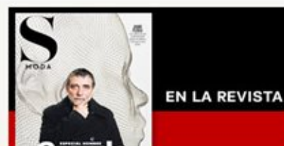
En la revista con El País: Jaime Plensa