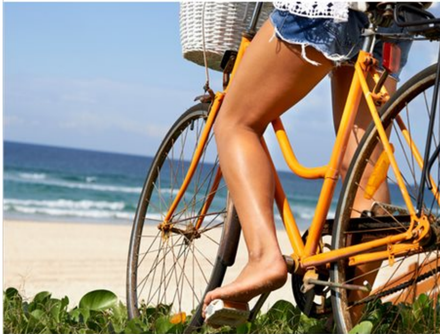
Las varices se producen por un mal funcionamiento de las válvulas de los vasos sanguíneos

SALOMÉ GARCÍA | 17 DE MARZO DE 2015 | 07:39 H.